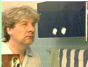
Graue Haare, Falten, schlaffe Haut – irgendwann trifft es jeden. Das Alter schlägt erbarmungslos zu

Warum Menschen, Tiere und Pflanzen altern, ist bis heute ein Rätsel geblieben. Immerhin kennen Wissenschaftler eine Reihe von Mechanismen, die das Altern unserer Zellen bestimmen. Grundsätzlich werden zwei unterschiedliche Erklärungsmuster für den Alterungsprozess genannt, die sich teilweise auch widersprechen: die einen meinen, dass Altern einfach die Folge verschiedener Abnutzungserscheinungen sei, andere Theorien gehen davon aus, dass das Altern bereits in irgendeiner Form genetisch festgelegt sei. Die meistgenannte Erklärung für das Altern der Zelle (Freie Radikale) geht ebenfalls von Verschleißerscheinungen aus.