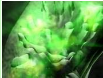
Sogenannte Freie Radikale entstehen beim Verbrennungsprozess in den Mitochondrien, den Kraftwerken, der Zelle

"Freie Radikale" werden Moleküle genannt, denen je ein Elektron fehlt und die deshalb versuchen anderen Molekülen in ihrer Nähe Elektronen zu entreißen. Diese unvollständigen Moleküle sind zumeist Sauerstoffmoleküle, die in den Mitochondrien der Zelle beim normalen Verbrennungsprozess entstehen. Neben den Sauerstoffradikalen sind Sauerstoff-Stickstoffradikale, Wasserstoffperoxid und Hydroxylgruppen bekannt.